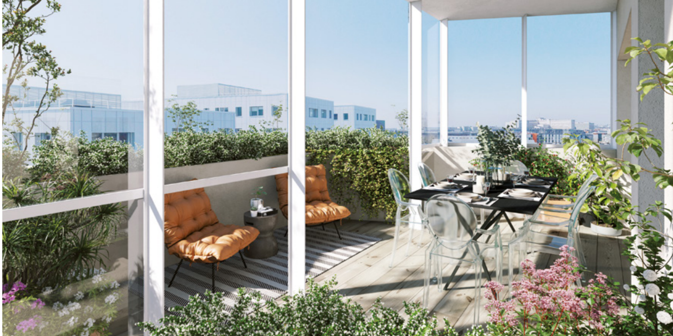
T2 de 45,80 m 2 Loggia de 12 m 2