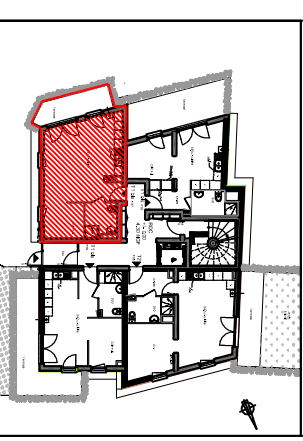
PLAN DE REPERAGE